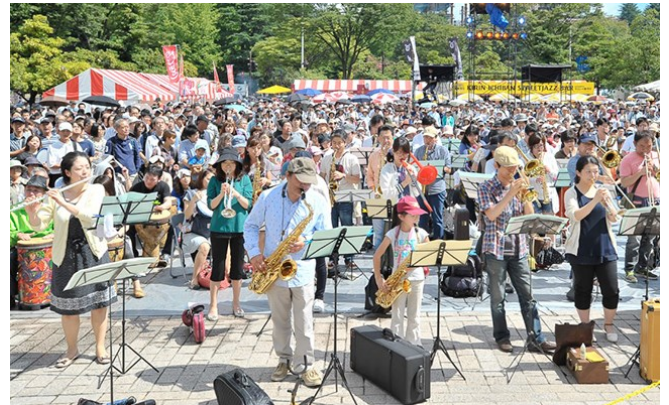
定禅寺ストリートジャズフェスティバルの様子 チームの在り方をイメージした

これから市民とのセッション（協働）を創り出していきます。まずは会員のみなさんの音を聞かせてください。