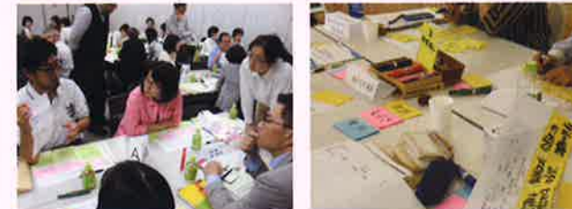
組織の課題を深掘りしながら、課題の根本を捉えるワークを行います。